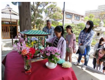
あまちゃでまいり