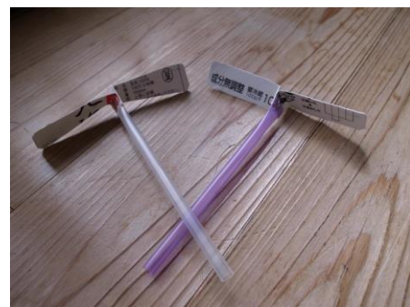
工作 かみコプター