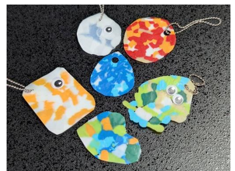
工作教室「リサイクルキーホルダー」 ペットボトルキャップ使って作ります