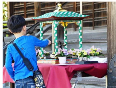
あまぢやでおまいり